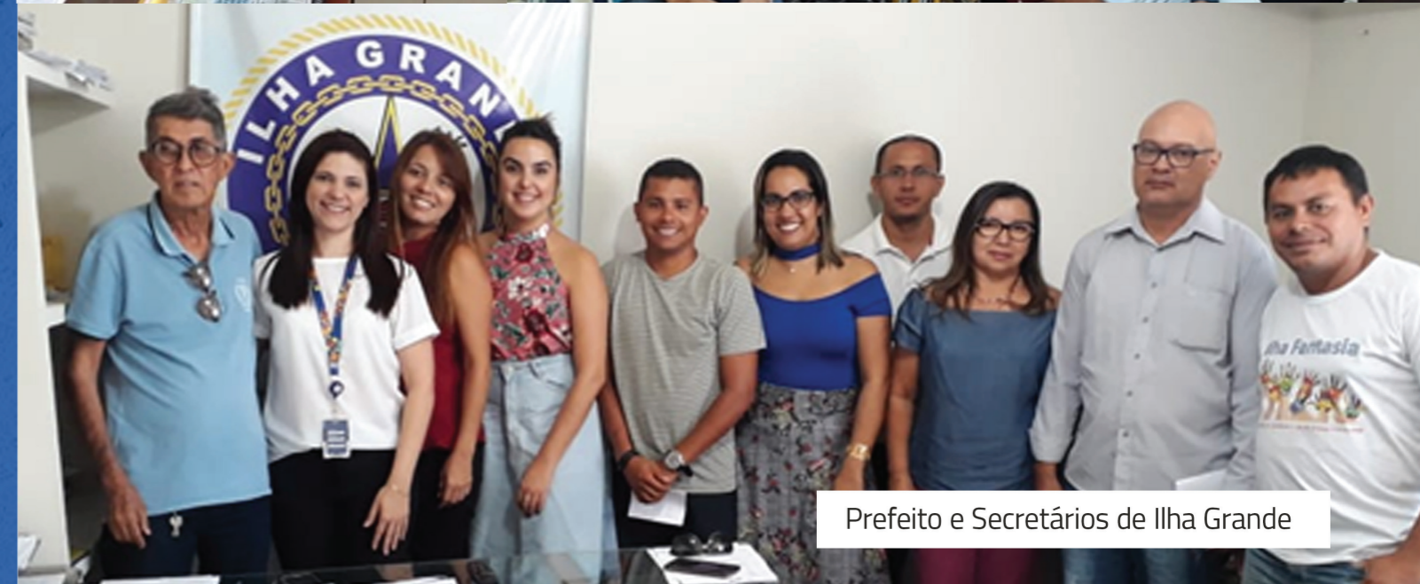
Prefeito e Secretários de Ilha Grande