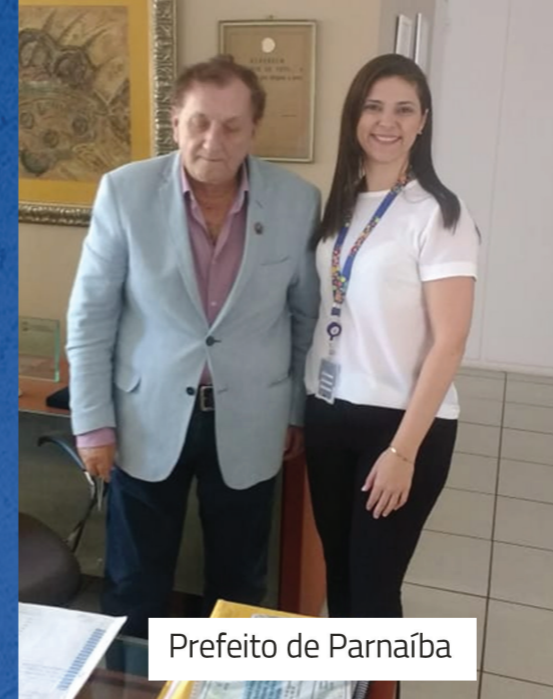
Prefeito de Parnaíba

O objetivo desse relatório é descrever as ações realizadas nessa regional para que o resultado fosse atingido conforme planejamento, com a população preparada para receber o sinal digital.