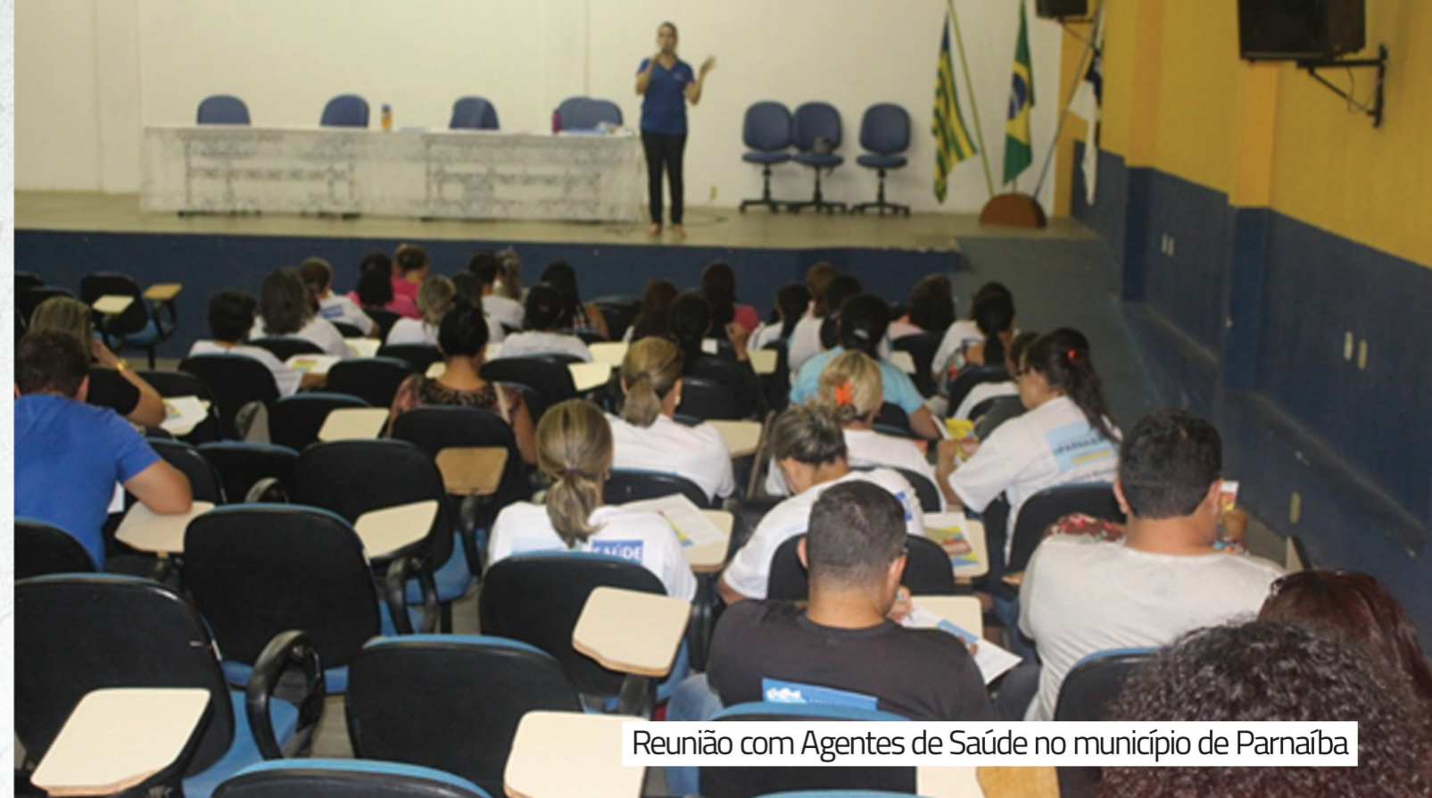
Reunião com Agentes de Saúde no município de Parnaíba