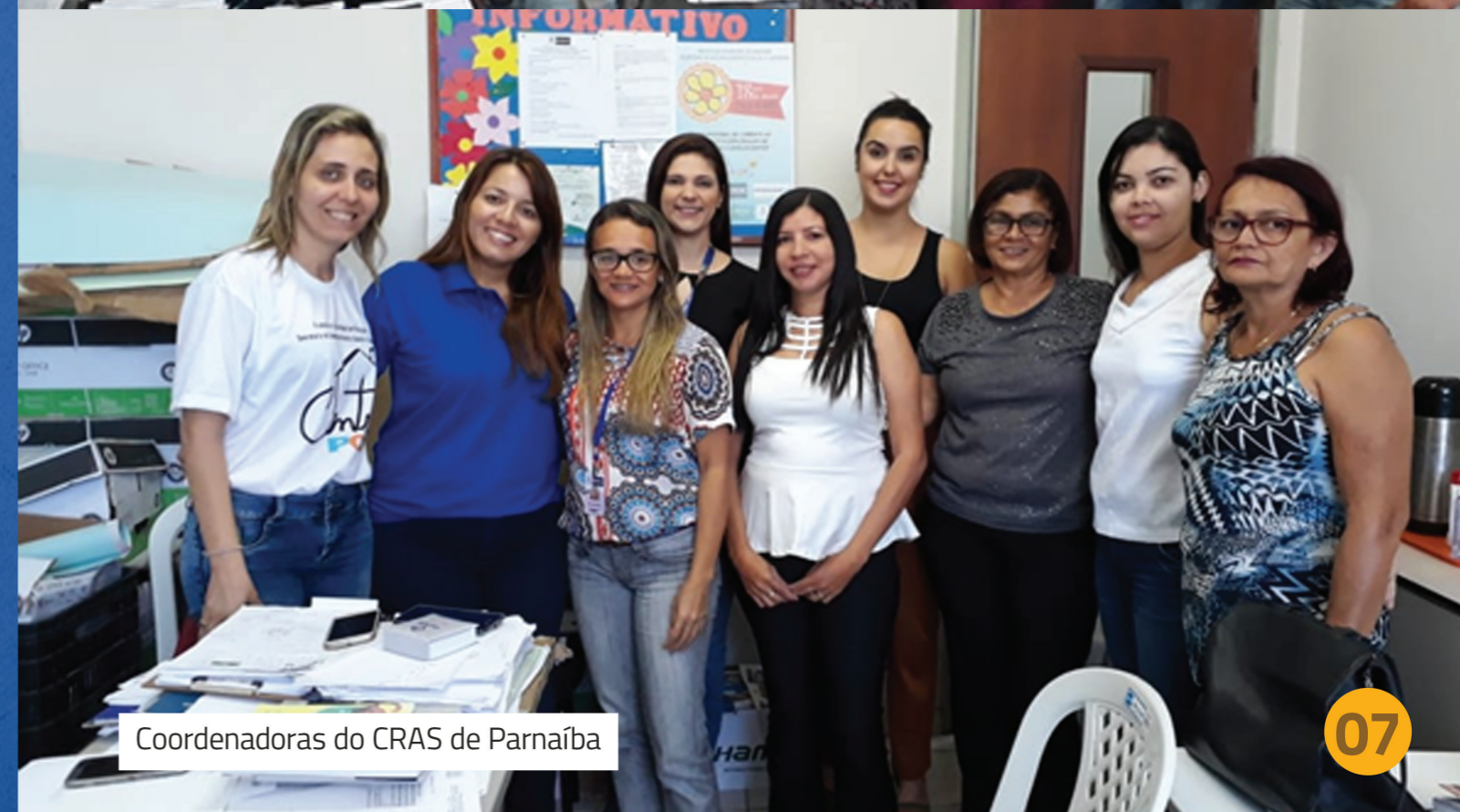
Coordenadoras do CRAS de Parnaíba