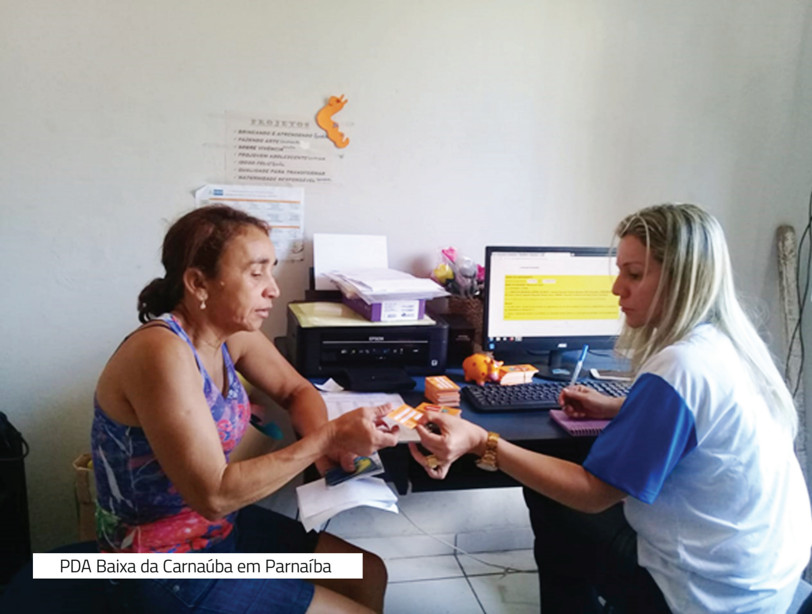
PDA Baixa da Carnaúba em Parnaíba