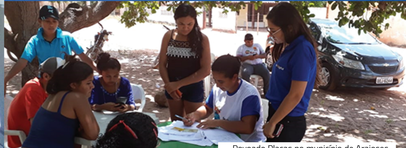
Povoado Placas no município de Araisos

Com o intuito de promover a divulgação do projeto e atingir à população beneficiária dos Programas Sociais do Governo Federal, a Seja Digital realizou 31 mutirões de agendamento que aconteciam em pontos estratégicos nas comunidades, escolas, praças, equipamentos públicos, entre outros. A equipe de mobilizadores devidamente capacitada realizava agendamentos, tiravam dúvidas quanto à migração, instalação e principalmente quanto ao perfil de pessoas que podiam ser beneficiadas com o Kit Gratuito. O agendamento era realizado e o beneficiário encaminhado para retirar seu Kit no ponto mais próximo ou mais adequado a sua realidade.