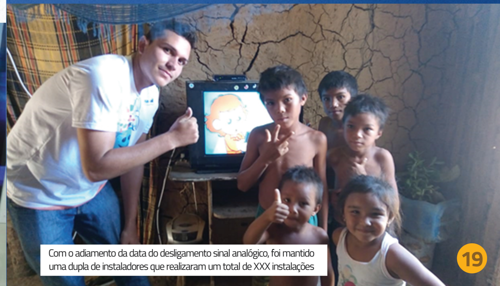
Com o adiamento da data do desligamento sinal analógico, foi mantido uma dupla de instaladores que realizaram um total de XXX instalações

Foram realizados cerca de 500 instalações durante 30 dias no município de Parnaíba.