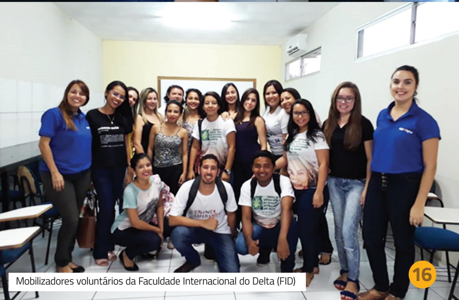
Mobilizadores voluntários da Faculdade Internacional do Delta (FID)

Este processo deu início no mês de novembro, envolvendo tanto 04 colaboradores da ONG ECOS e mais 12 voluntários da Faculdade Delta e lideranças comunitárias. Foi realizada cerca de 1800 ligações, com cerca de 950 agendamentos.