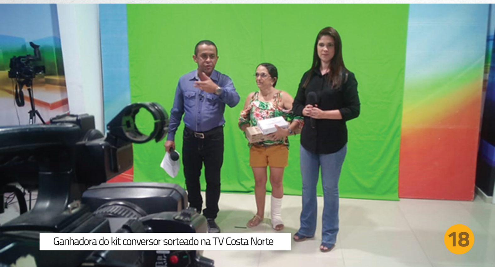
Ganhadora do kit conversor sorteado na TV Costa Norte

Também foram doados kits gratuitos com solicitação através de ofícios, beneficiando órgãos públicos, sorteios e doações a voluntários que trabalharam durante todo o processo, totalizando 403 kits doados.