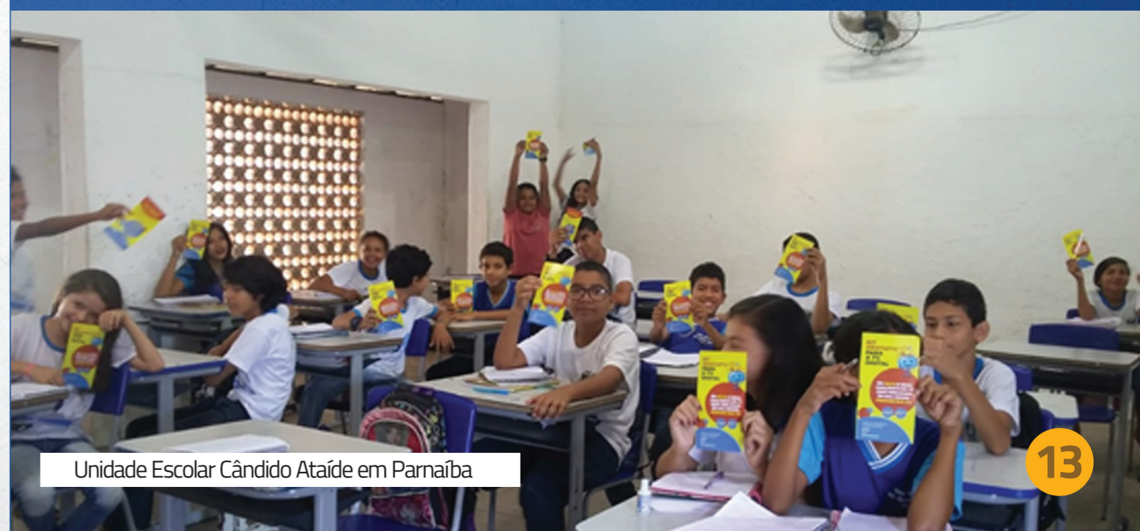
Unidade Escolar Cândido Ataíde em Parnaíba

Essa atividade foi realizada em 33 escolas, sendo 16 em Parnaíba, 11 em Ilha Grande e 05 em Araioses, impactando cerca de 9 mil alunos.