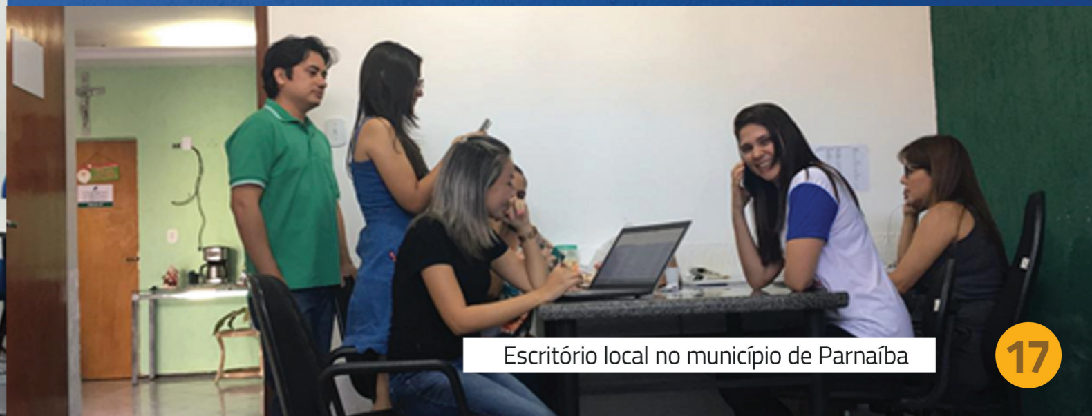
Escritório local no município de Parnaíba