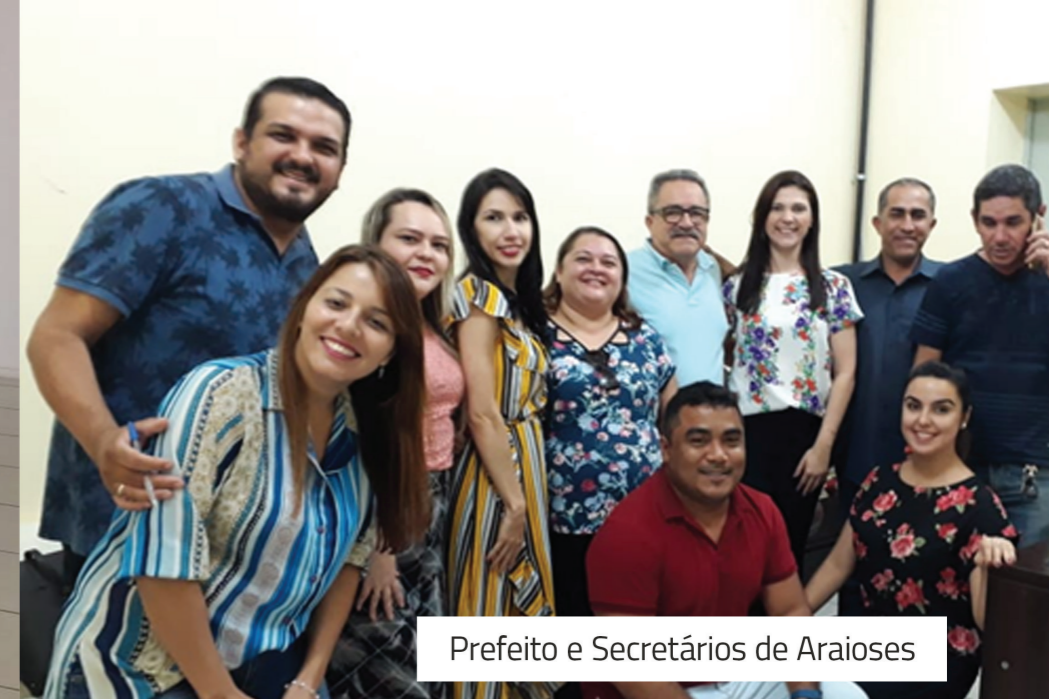
Prefeito e Secretários de Araisos